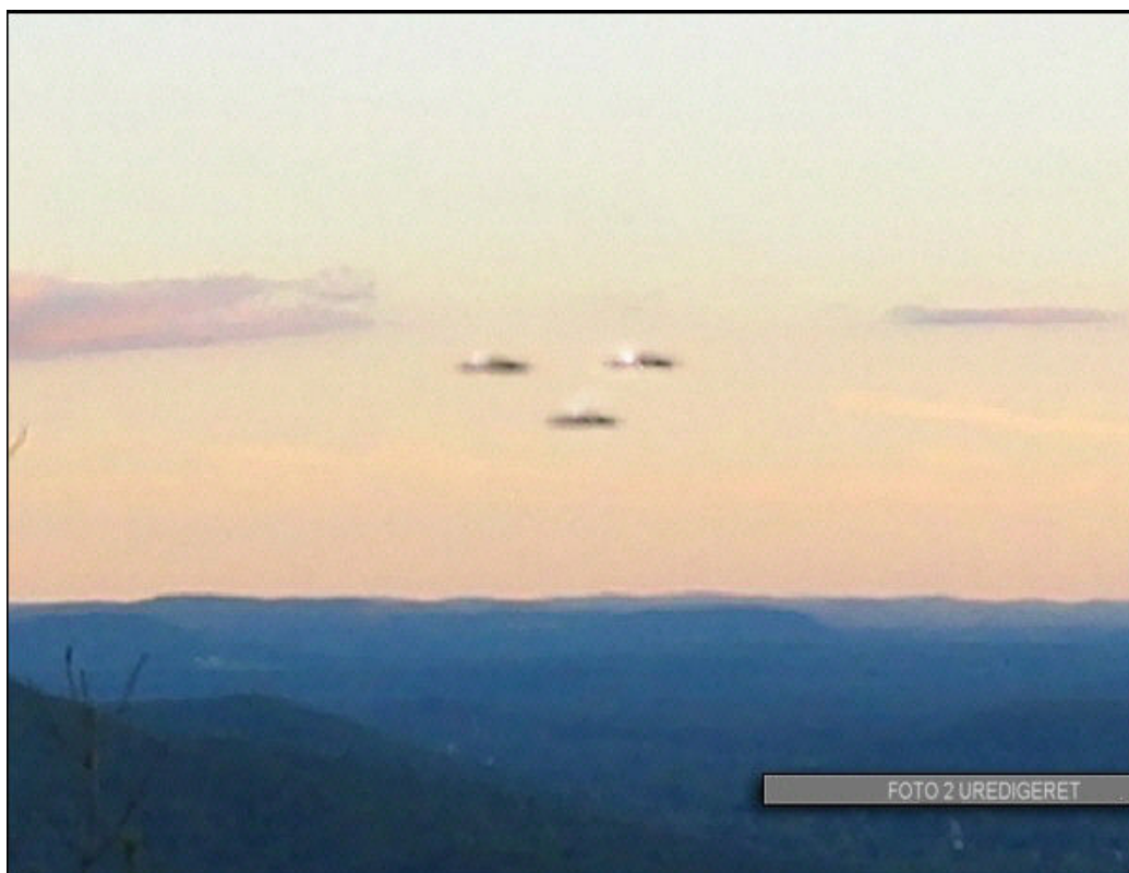
Bildet er tatt 10.10.2004 i Litchfield, Connecticut, USA.

”Jeg var på en familietur da vi stoppet ved en klippe ved solnedgang. En av mine sønner såg 3 metalliske objekter i det fjerne men allikevel rett på oss. Jeg tok et bilde av de objektene mens de beveget seg mot høyre. De svedde i en organisert formasjon, og de bevegde seg med varierende hastighet – de stoppet plutselig nå og da, og deretter beveget de seg hurtig til et nytt sted på himmelen. Mens de 3 objektene fløy, endret de ofte høyden, slik som posisjonen deres forandret seg hele tiden. Etter å ha sett disse objektene i 30 minutter, begynte mørket å falle på og min yngste sønn begynte å grine av redsel mens min kone var skrekkslagen. Vi forlot da stedet.”