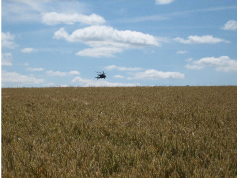
Helikopteret fløy veldig lavt over kornåkeren

Høviskeland takker Christian Wangsnes for intervjuet!