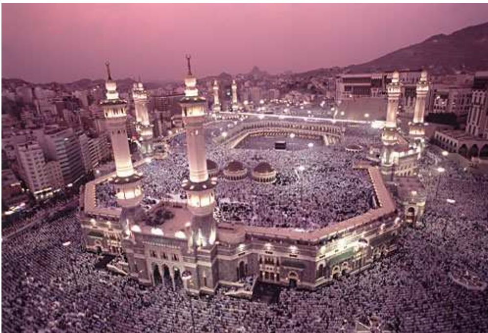
Mekka var kultsted for Sin/Allah lenge for Muhammeds tid

Nabonidus ble fordrevet av Marduk-presteskapet til Arabia, der han grunnla seks byer og reetablerte Nannar/Sin-kulten. Sin var en av de store gudene i Vest-Asia. På arabisk var hans navnetittel al-Ilah ( al = -en; ilah = gud): "guden", som ble sammentrukket til Allah . Sin/Allah-kulten ble den dominerende religionen i Arabia, og Mekka ble bygd til hans ære.