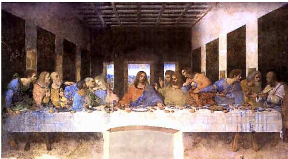
Er det satt av plass til (fantomet av) Eliah mellom Jesus og personen på venstre side, og hvorfor mangler det symbolske begeret til Eliah?

I kap. 15 diskuterer Sitchin Jesus og påskemåltidet, og han har noen interessante kommentarer til Leonardo da Vincis berømte maleri Det siste måltid og til legendene rundt The Holy Grail . Han bemerker også at jødene og kanskje hele Midt-Østen hadde store messianske forventninger til år 160 fvt., som ut fra den nippur'sk-hebraiske kalender ville være år 3600, dvs. fullførelsen av det første Nibiru-år! Det spilte ingen rolle hvor den fysiske planeten Nibiru faktisk befant seg i sin bane rundt Solen, for i det hebraiske år 3600 burde noe guddommelig-dramatisk skje! Mange forestilte seg at Yahweh ville komme flyvende i sitt romskip (i den hebraiske Bibelen omtalt som Kabod ) og lande på tempelplassen i Jerusalem. Men også dette året ble en stor skuffelse, for ingenting skjedde.