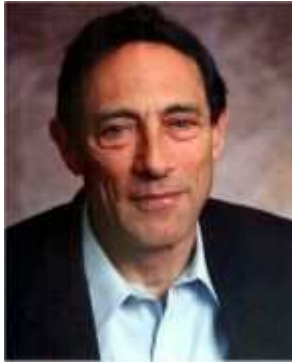
John E. Mack (1929-2004)

stoffer, som også ble brukt under det psykoterapeutiske arbeidet. Mack døde etter å ha blitt overkjørt av en full sjåfør i London.